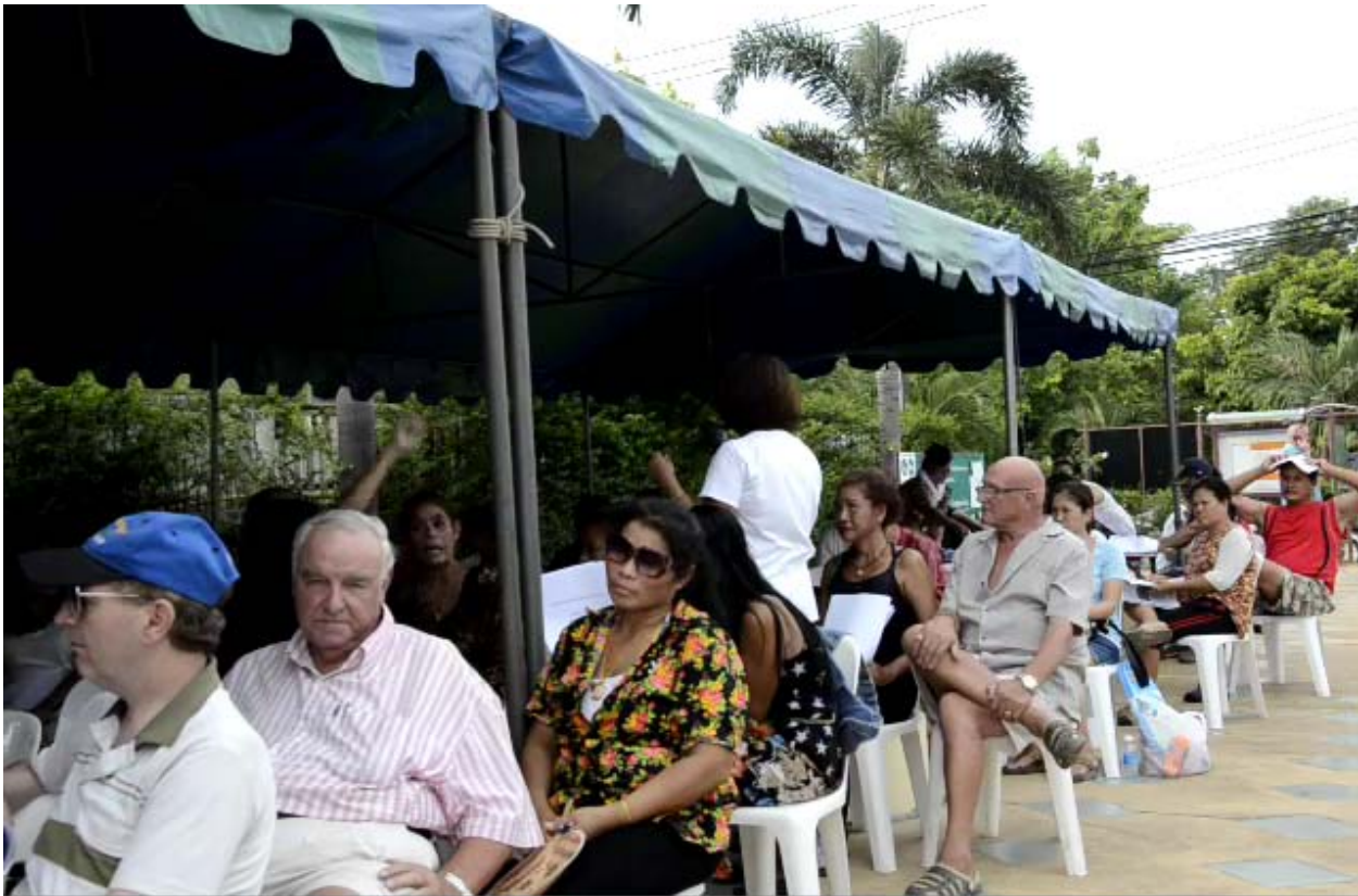
รูปภาพที่ 1