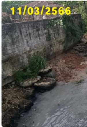
มติดังประชุม รับทราบ

วาระที่ ๓ ลงมติ เห็นชอบ หรือไม่เห็นชอบ ในการเก็บค่าส่วนกลางเพิ่ม จำนวน ๒๕๐ บาทต่อเดือน เป็นเวลา ๑ ปี ถึงจะสามารถนำมาจ่ายเป็นค่าซ่อมแซม ตามคำฟ้องได้